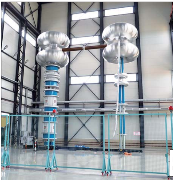
Новая испытательная станция открылась на заводе в этом году