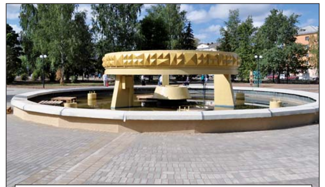
Благоустройство площади Калинина – замечательный подарок любимому городу к 850-летию от заводчан