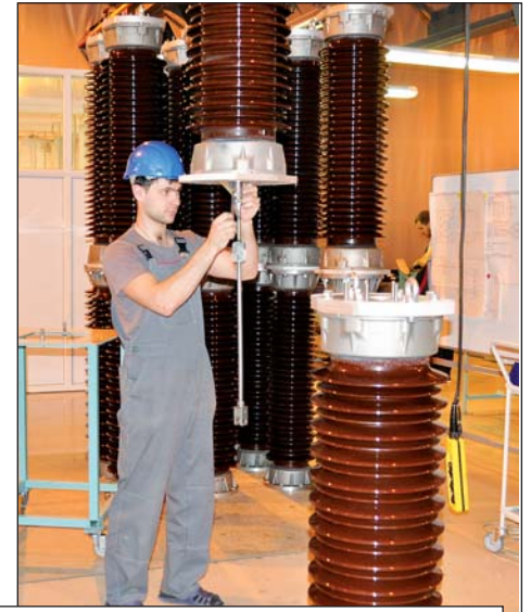
Завод электротехнического оборудования станет ядром первого промышленного кластера Псковской области