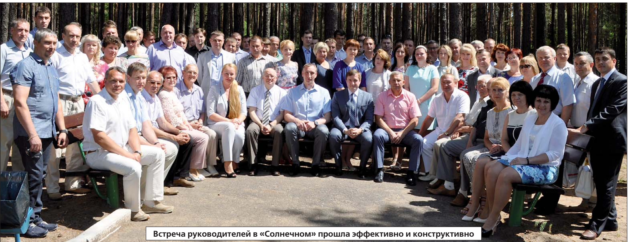
Встреча руководителей в «Солнечном» прошла эффективно и конструктивно