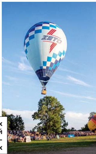
Завод стал одним из главных спонсоров юбилейной двадцатой международной встречи воздухоплавателей в Великих Луках