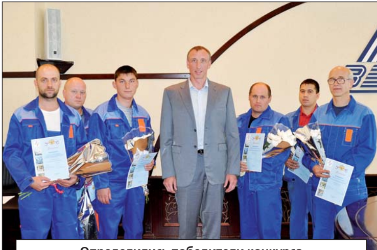
Определились победители конкурса профессионального мастерства