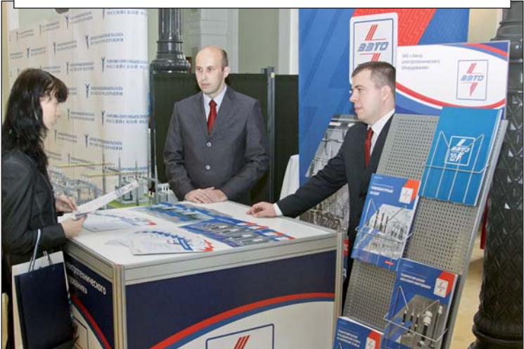
ЗАО «ЗЭТО» представило свои экспозиции в ходе презентации экономического и инвестиционного потенциала Псковской области, прошедшей в конгресс-центре Торгово-промышленной палаты Российской Федерации