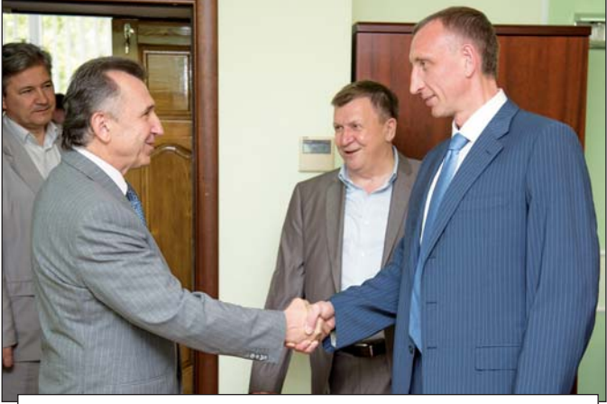
Завод активно участвует в создании системы энергобезопасности полуострова Крым